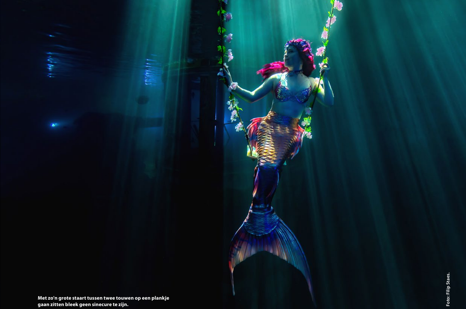
Met zo'n grote staart tussen twee touwen op een plankje gaan zitten bleek geen sinecure te zijn.