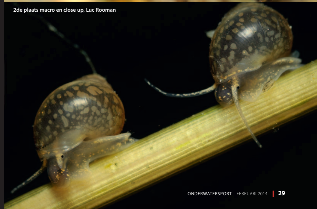
2de plaats macro en close up, Luc Rومان