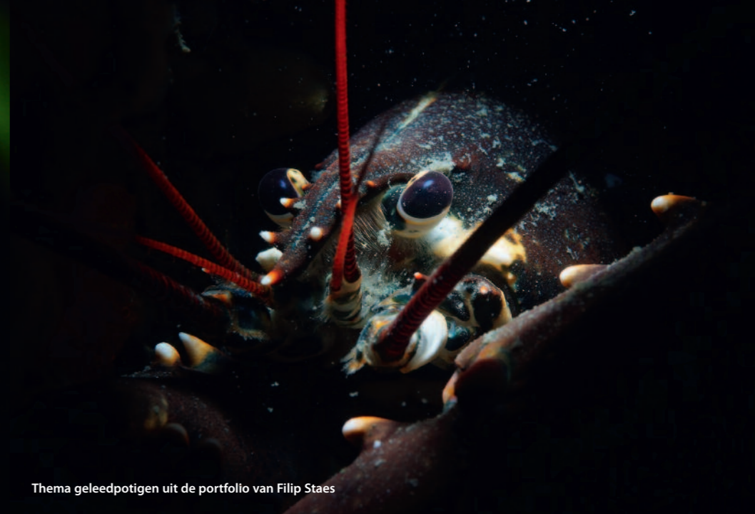
Thema geledpotigen uit de portfolio van Filip Staes