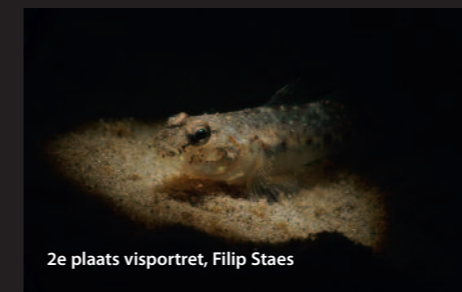
2e plaats visportret, Filip Staes