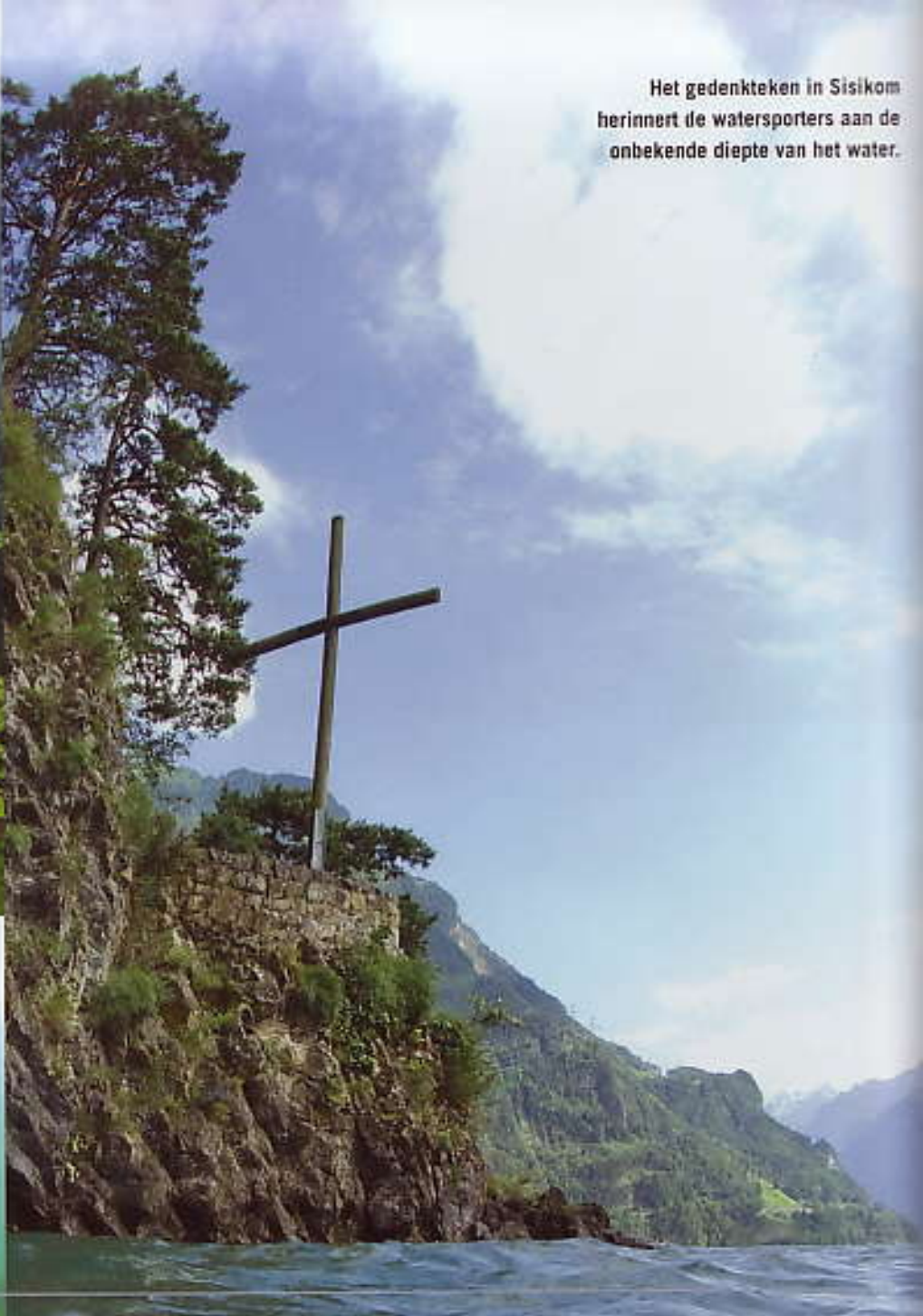
Het gedenkteken in Sisikom herinnert de watersporters aan de onbekende diepte van het water.

Boven de 2000 meter is pas écht bergmeerduiken