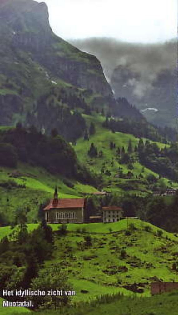
Het idyllische zicht van Muotadal.