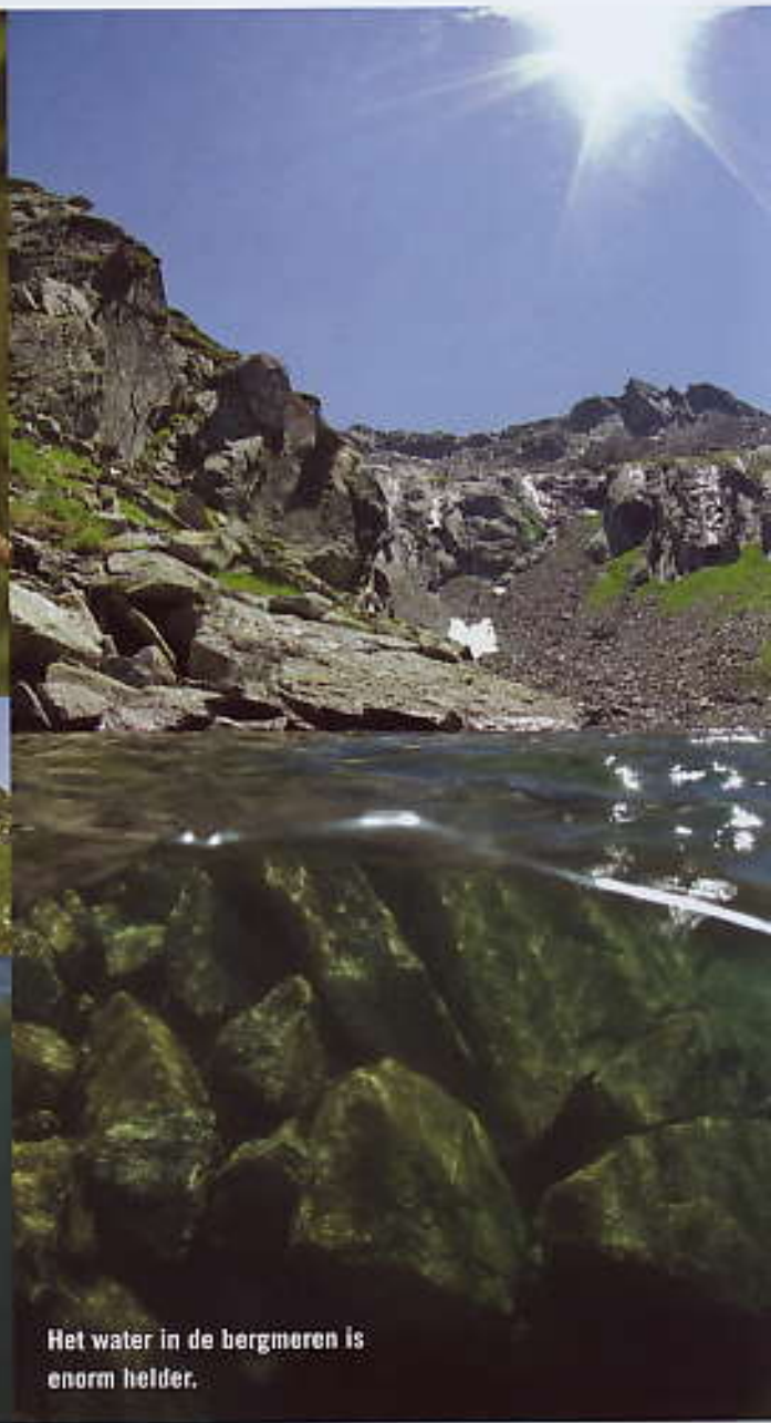
Het water in de bergmoores is enorm helder.

Het regent als we het kanton Schwyz binnenrijden. Onze eindbestemming ligt echter hoog en droog naast het Vierwoudstedenmeer. Vlakbij het stadje Brunnen gaan we een steile weg op richting Morschach. Het kleine dorpje is gedurende één week onze uitvalsbasis voor een aantal uitstappen. Koen