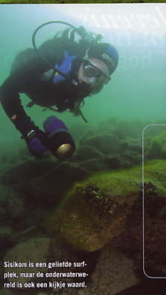
Sisikom is een geliefde surf-plek, maar de onderwaterwereld is ook een kijkje waard.