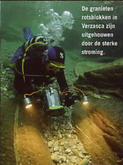
De granieten rotsblokken in Verzasca zijn uitgehouwen door de sterke stroming.