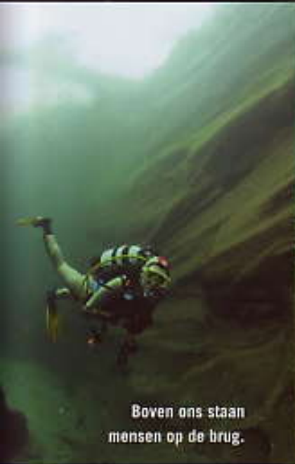
Boven ons staan mensen op de brug.