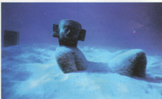
6 - Fun Duiken

is. Veelkleurige keizer en engelvissen zweven sierlijk boven de koraalriffen terwijl grootoogmakrelen en barracuda's ons argwanend vanop vei-