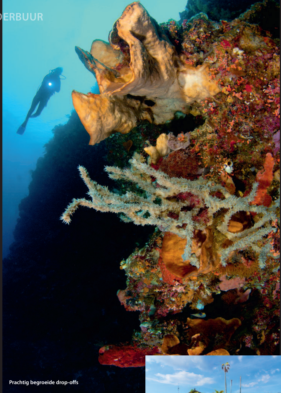
Prachtig begroeide drop-offs

Een goede optie om de zuidelijke riffen te verkennen is een accommodatie te kiezen die iets ten zuiden van Manado ligt. De riffen in het zuiden zijn dan op enkele minuten bereikbaar. Ze zijn duidelijk minder bedoken en zeker een bezoekje waard. Vergeet vooral ook de macrolens eens niet op te zetten om al de naaktslakken, hengelaarsvissen, speciale krabben en garnalen en veel ander klein spul te fotograferen.