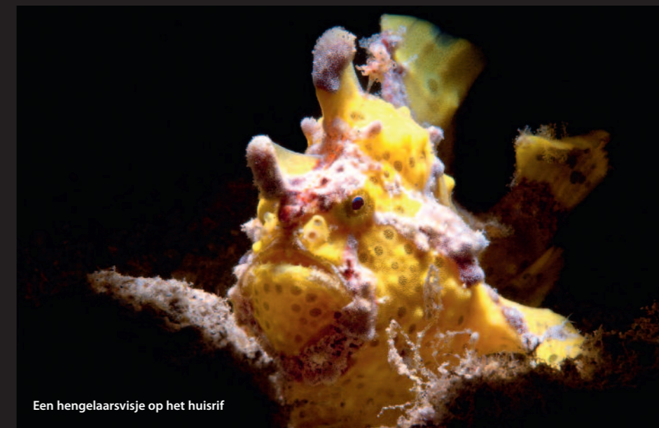
Een hengelaarsvisje op het huisrif