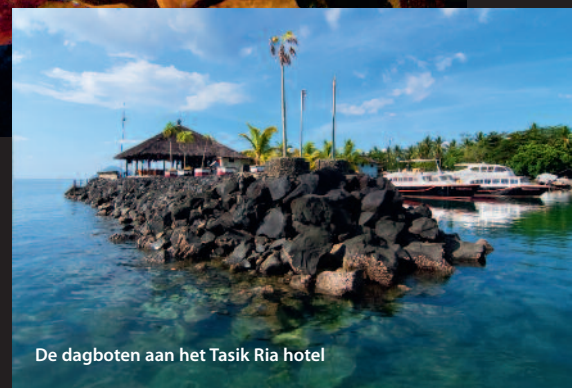
De dagboten aan het Tasik Ria hotel