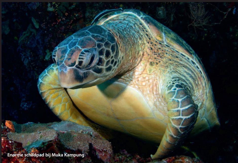
Enorme schildpad bij Muka Kampung