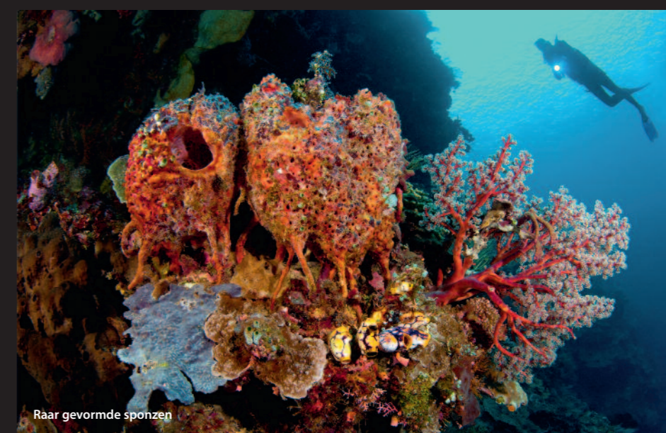
Raar gevormde sponzen