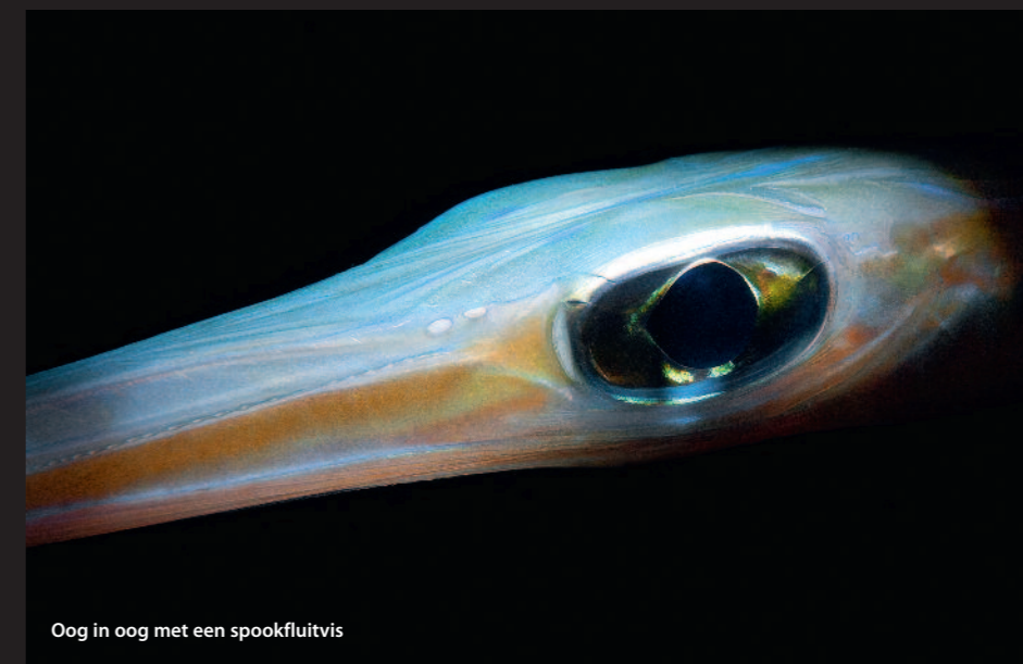
Oog in oog met een spookfluitvis