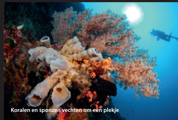
Koralen en sponzen vechten om een plek