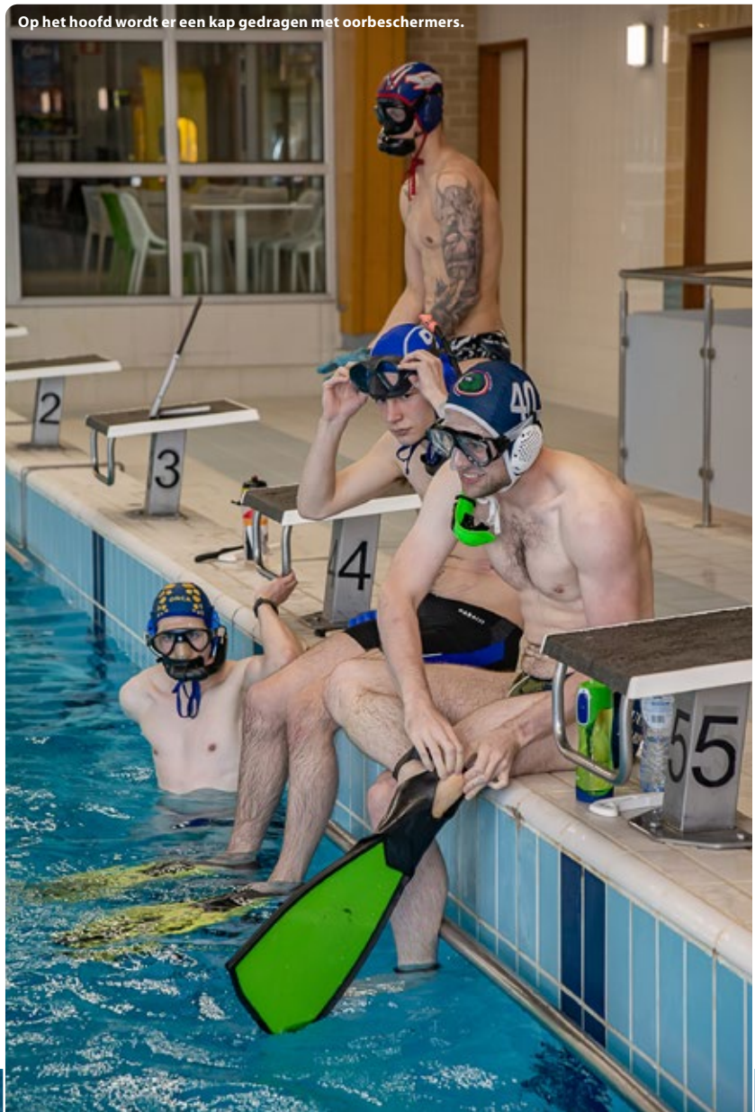
Op het hoofd wordt er een kap gedragen met oorbeschermers.