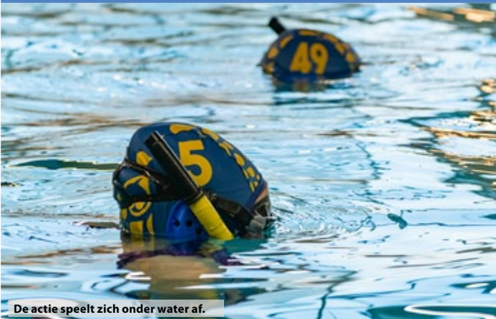
De actie speelt zich onder water af.

Filip Staes is geen onbekende in de onderwaterfotografie wereld. Hij behaalde de afgelopen twintig jaar vele podiumplaatsen tot ver over de grenzen heen. Meer info hierover op zijn website www.FSfotografie.be . In 2020 richtte hij zijn eigen onderwaterfotografie-academie op waar je onder andere webinars, workshops, themaduiken, groepsreizen en individuele opleidingen van starter tot gevorderde fotograaf kan volgen. Meer info hierover op www.o-f-a.be .