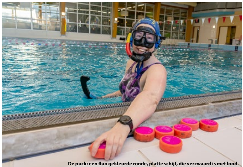
De puck: een fluo gekleurde ronde, platte schijf, die verzwaard is met lood.

Een team bestaat uit zes spelers en maximum vier reservespelers. Die mogen voortdurend gewisseld worden. Tijdens een wedstrijd wordt de volledige lengte van een vijftientig meter bad gebruikt en is er aan weerszijden een doel. Dat is een metalen goot van drie meter lang waar je de puck moet zien in te krijgen. De spelers hebben een korte stick van ongeveer 30 cm lang in één hand die beschermd wordt door een