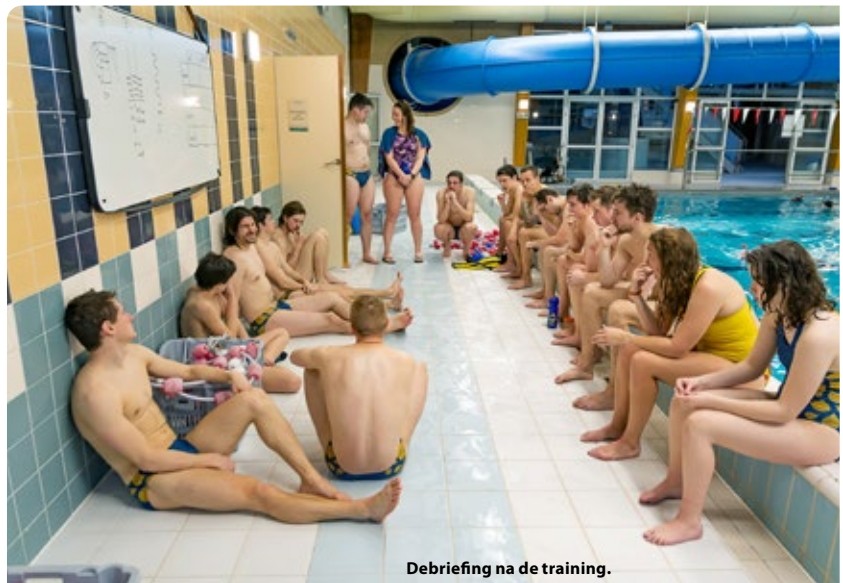
Debriefing na de training.

Tijdens de laatste Algemene vergadering van NELOS zijn er drie commissies aan het organogram toegevoegd: vrijduiken, vinzwemmen en onderwaterhockey. Ze bestonden al wel langer, maar dan als subcommissie. Nu zijn ze een trede omhooggeklimmen.