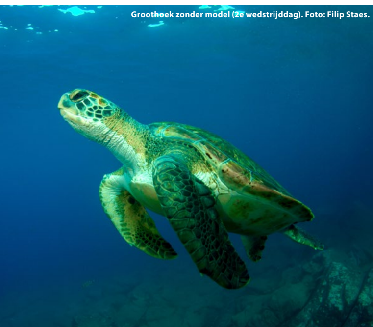
Groothoek zonder model (2e wedstrijddag).

Dag twee van de competitie begon slecht. Het nieuws sijpelde binnen dat het Spaanse fototeam betrappt zou zijn met veel meer lucht in hun flessen dan de andere deelnemers.