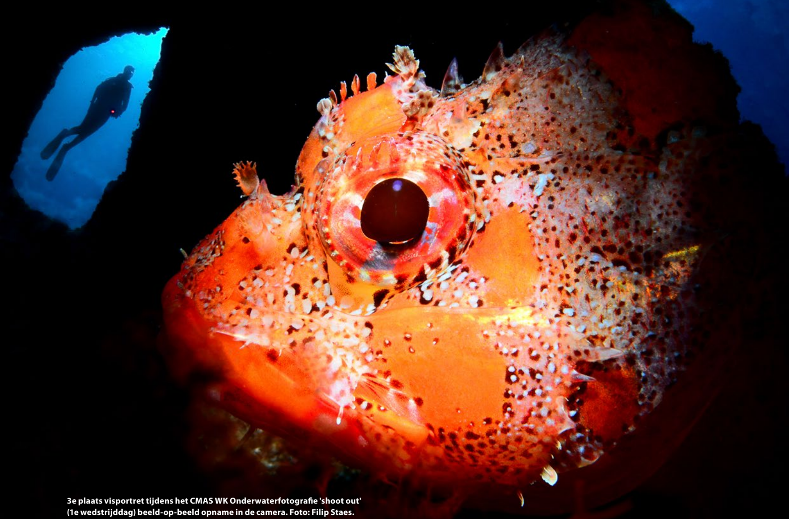
3e plaats visportret tijdens het CMAS WK Onderwaterfotografie 'shoot out' (1e wedstrijddag) beeld-op-beeld opname in de camera.