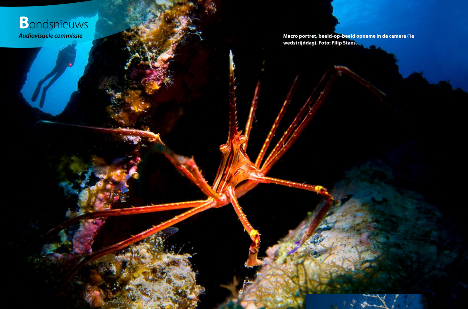
Macro portret, beeld-op-beeld opname in de camera (1e wedstrijd).

Met 260 bar op 200 bar 12-flessen zouden ze niet alleen langer kunnen duiken, maar brachten ze ook hun mededukkers in gevaar. Er werd een officiële klacht ingediend en die werd ondertekend door alle landen met uitzondering van Chili. Het gevolg was dat de organisatie op het einde van de dag en na lang overleg hun verdict meedeelde: de vice- en wereldkampioen van twee jaar geleden werden uit de wedstrijd gezet. Het