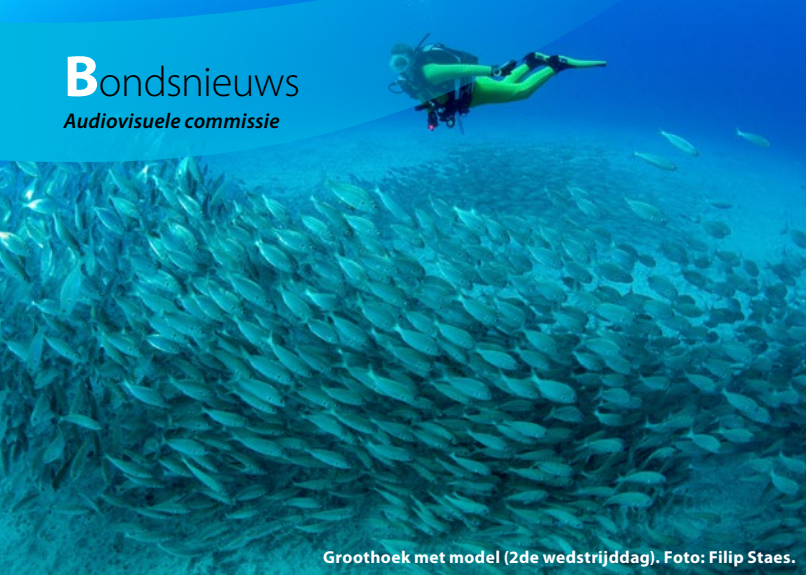
Groothoek met model (2de wedstrijddag).