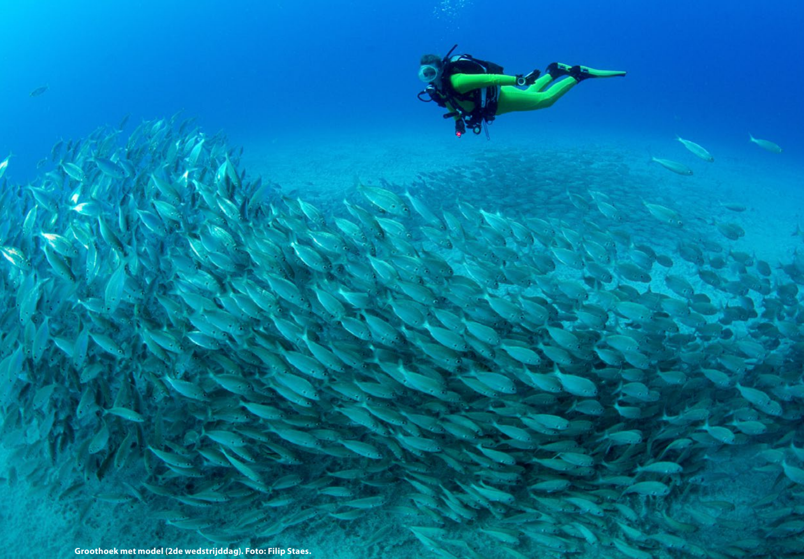
Groothoek met model (2de wedstrijddag).

minimale resterende druk van 30 bar na de duik werd zorgvuldig nagekeken en genoteerd. De twee volgende dagen werden er twee duiken per dag gemaakt. In totaal vier duiken op vier verschillende duikstekken met vijf categorieën: macro, visportret,