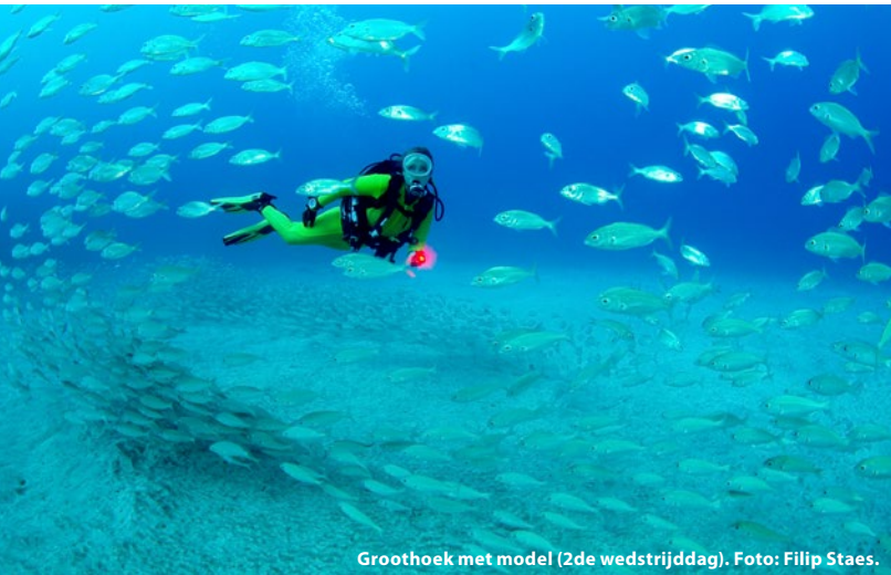
Groothoek met model (2de wedstrijddag).