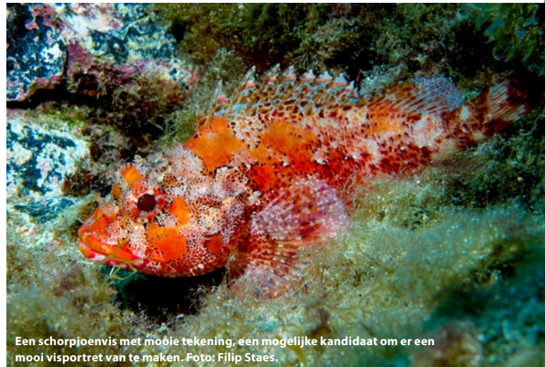
Een schorpioenvis met mooie tekening, een mogelijke kandidaat om er een mooi visportret van te maken.