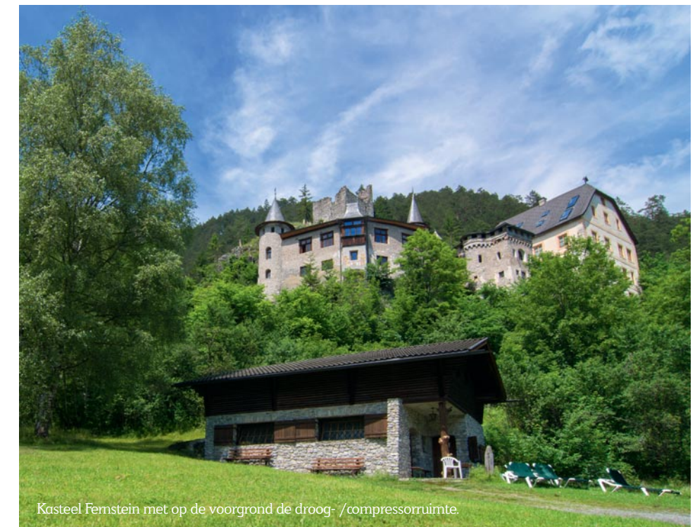
Kasteel Fernstein met op de voorgrond de droog-/compressoruimte.

oppervlak. De zonnestralen zijn verdwenen en het bijhorende licht ook. Het zal er de volgende dagen niet op verbeteren. En dat is meteen ook de enige kritische noot die men kan bedenken voor dit kleine paradijs. Door de ingesloten ligging tussen hoge bergen is er hier geen enkele garantie op goed weer. Binnen enkele jaren kom ik nog wel eens terug, bij de volgende hittegolf.