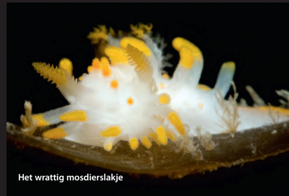
Het wrattig mosdiertjeslakje