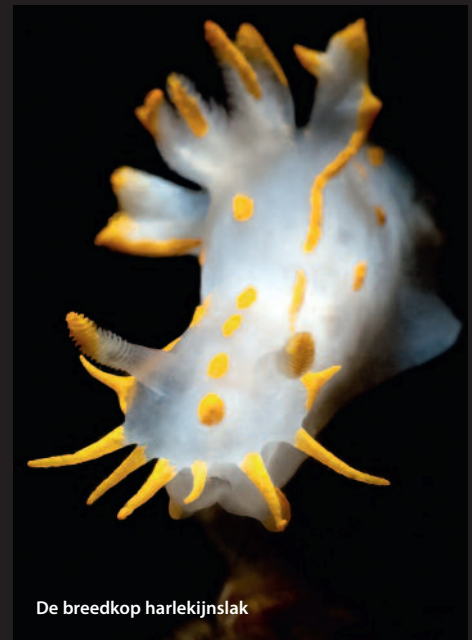
De breedkop harlekijnslak