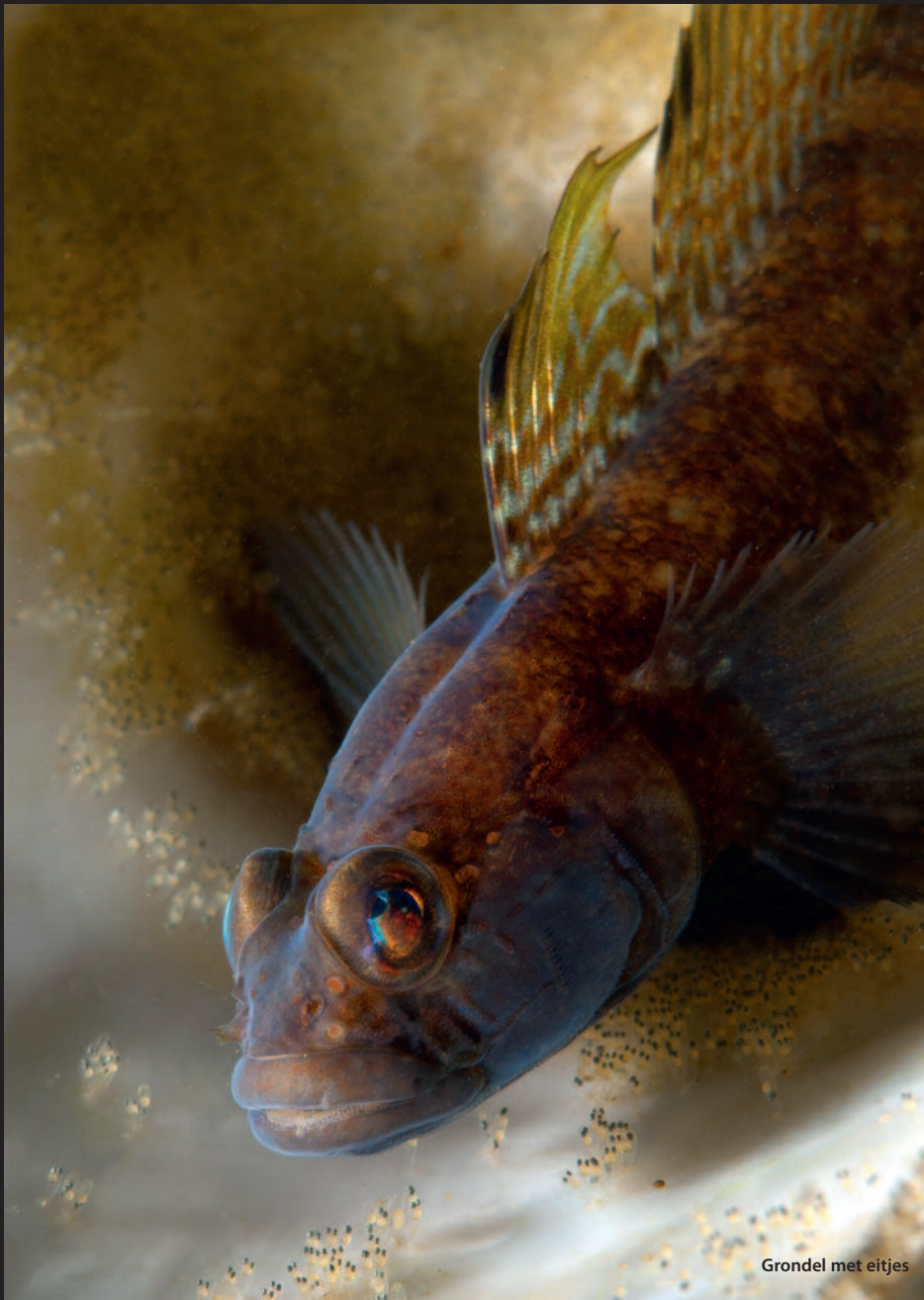
Grondel met eitjes

ven. Niet de ouders, die waren al lang weg. De jongere generatie, soms maar één centimeter groot, maar o zo lief, zat verstopt tussen het wakamé wier. Tenminste, dat dachten ze, maar met zo'n opvallend oranje kleurtje en 'Zorro' maskertje aan de ogen vielen ze wel enorm op.