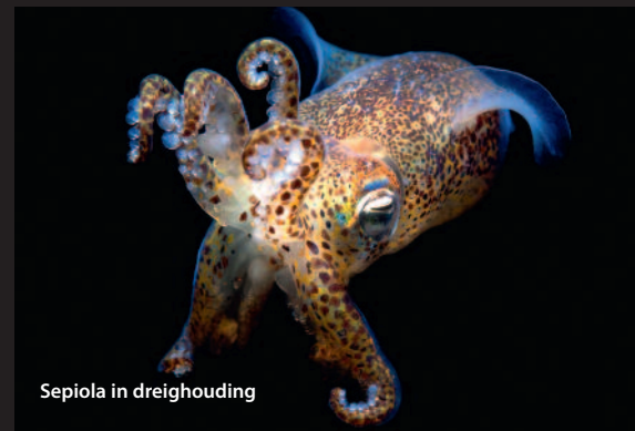
Sepiola in dreighouding