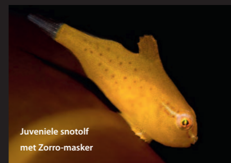
Juvenile snotolf met Zorro-masker

In de lente was er dan weer totaal onverwacht een ontmoeting met een slakdolf. Bij Den Osse aan het Grevelingenmeer, op 18 meter diepte nog wel. Zijn uiterlijk doet niet vermoeden dat hij tot de orde van de schorpioenvisachtigen behoort. Net als de snotolf planten ze zich voort tijdens de wintermaan-