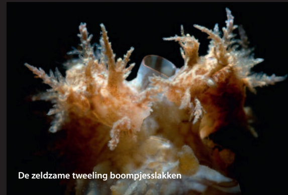
De zeldzame tweeling boompjesslakken

Kortom, het hele jaar door was er wel iets te beleven in de Zeeuwse wateren. Op naar een nieuw duikjaar!