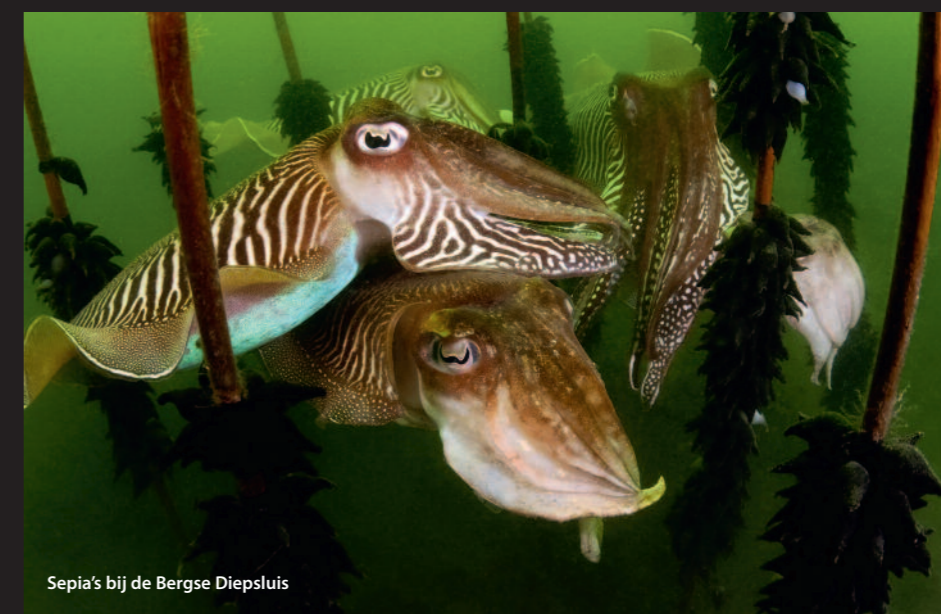
Sepia's bij de Bergse Diepsluis