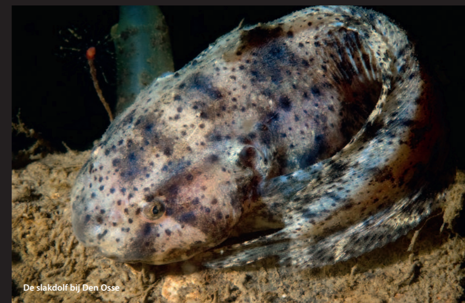
De slakdolf bij Den Osse