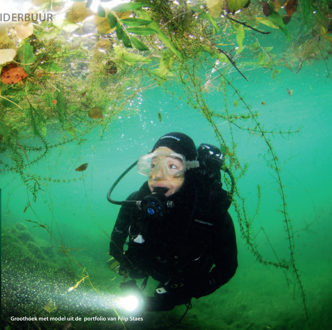
Groothoek met model uit de portfolio van Filip Staes

zat aardig vol die avond. De deelnemers waren tezamen met vele sympathisanten afgezakt om er de afloop van de wedstrijd te horen. Zoals altijd moesten er eerst nog een aantal plichtplegingen gemaakt worden. Sponsors en jury werden voorgesteld. Bij die laatste ondermeer twee Nederlanders: Rinie Luyck bij de fotografen en Harmen van den Heuvel voor de videografen.