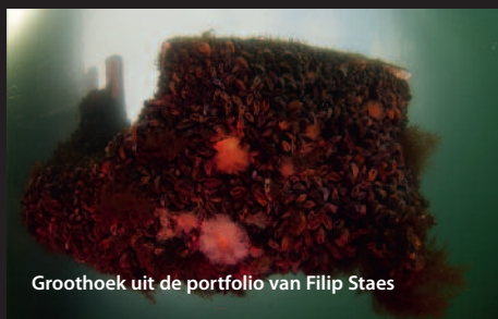
Groothoek uit de portfolio van Filip Staes