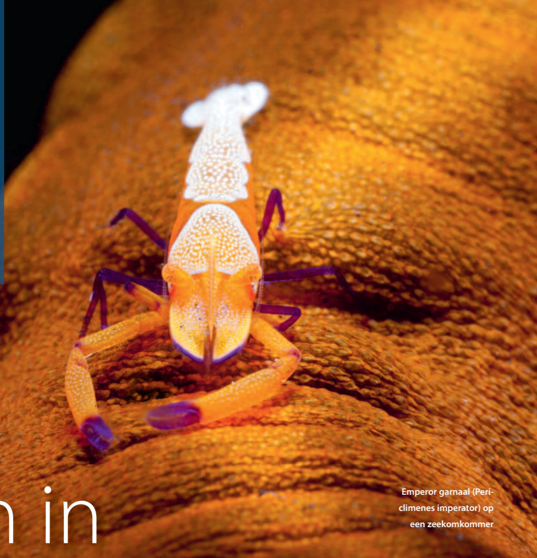
Emperor garnaal ( Periclimenes imperator ) op een zeekommer