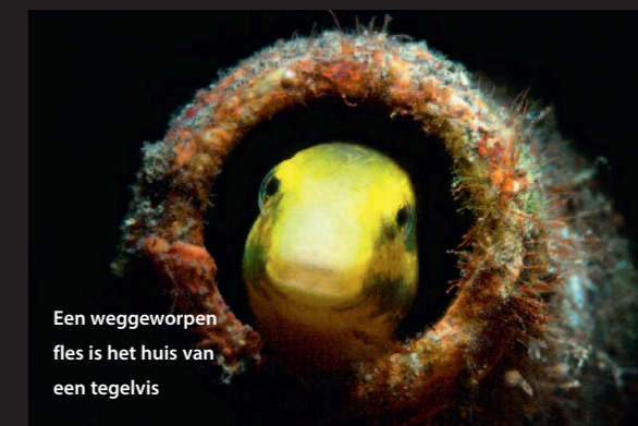
Een weggeworpen fles is het huis van een tegelvis