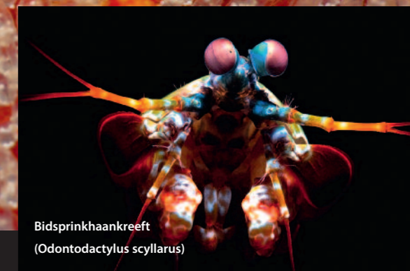
Bidspinkhaankreeft ( Odontodactylus scyllarus )