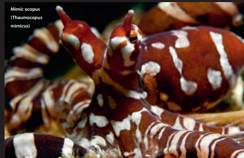
Mimic ocopus ( Thaumocopus mimicus )