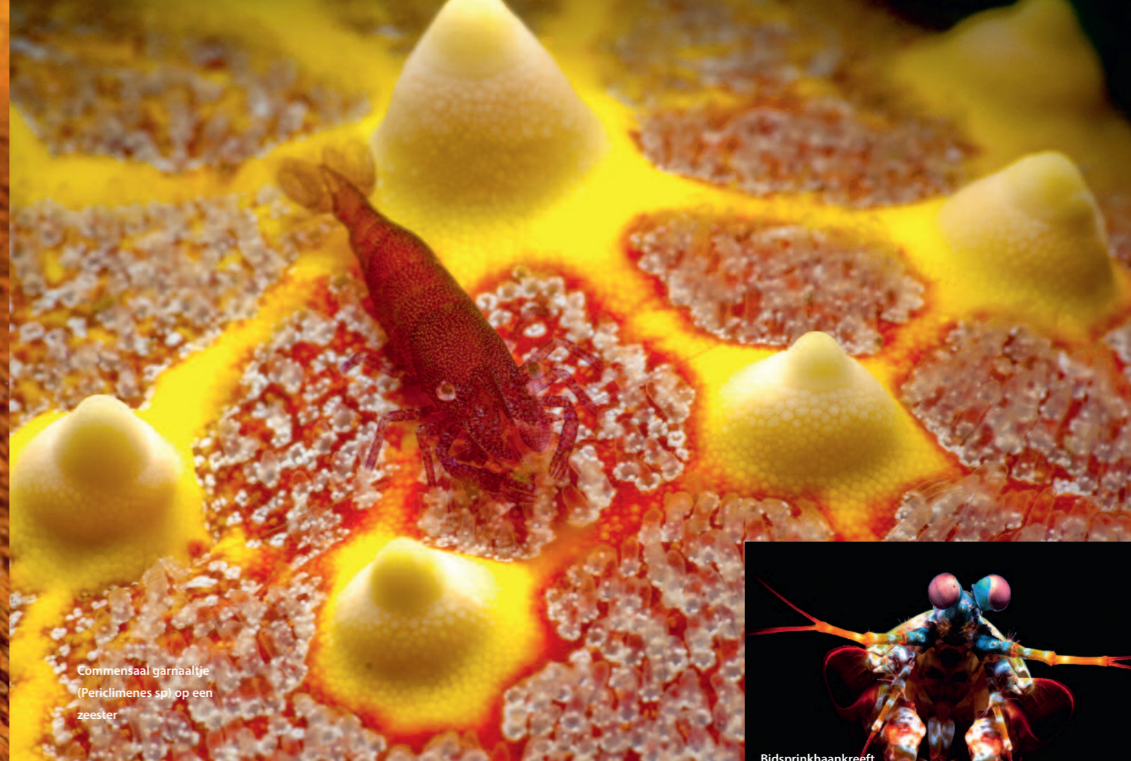
Commensaal garnaltje ( Periclimenes sp.) op een zeester