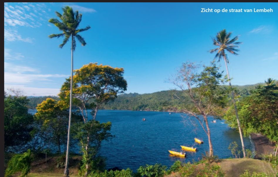
Zicht op de straat van Lembeh

Dieren die je overdag niet vaak te zien krijgt, zoals bijvoorbeeld de boos uitzierende Devil stinger, lopen of kruipen dan zomaar voor de